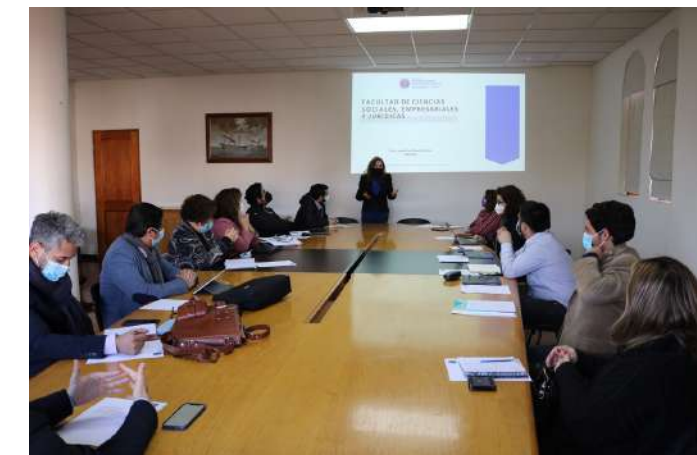
Decana expone en Gabinete Económico Regional