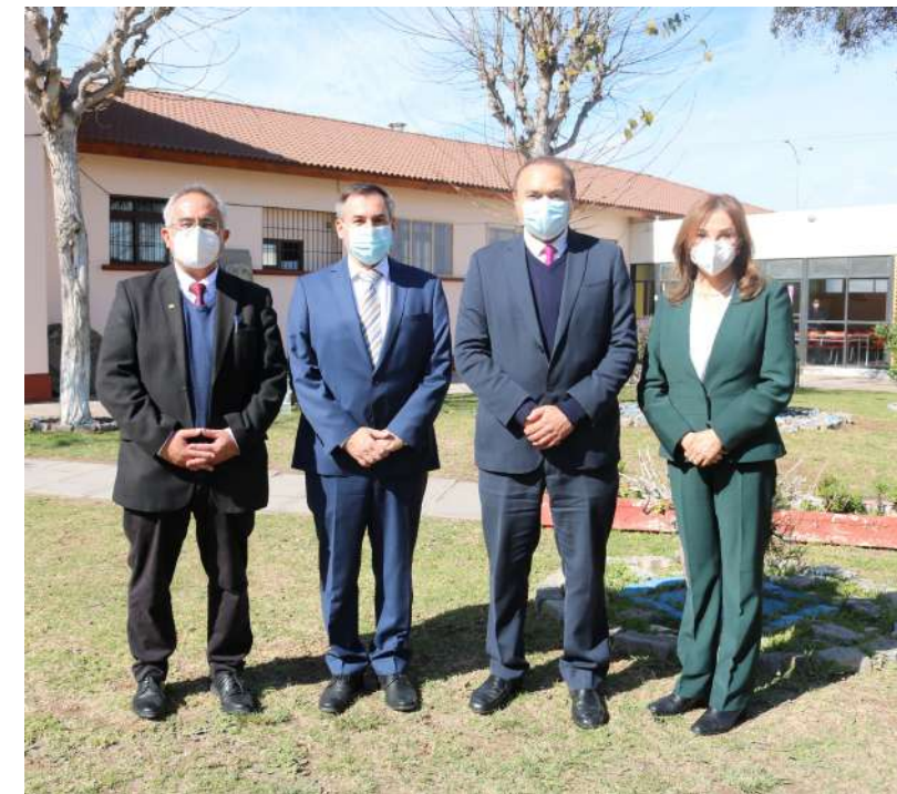
Embajador de Hungría visita la FACSEJ