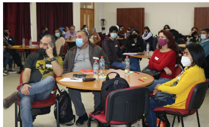
Diálogo por la Reforma Tributaria