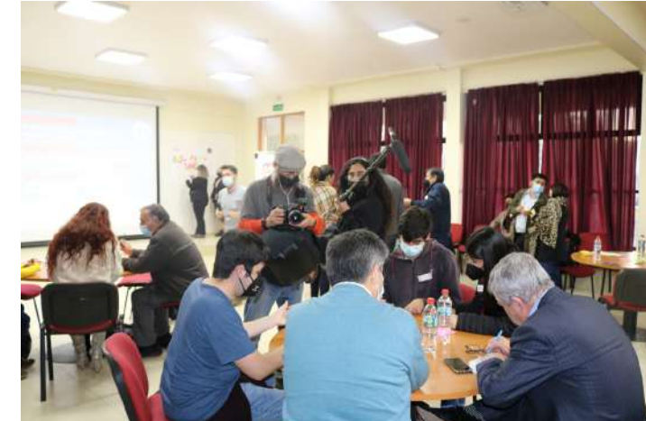
Diálogo por la Reforma Tributaria