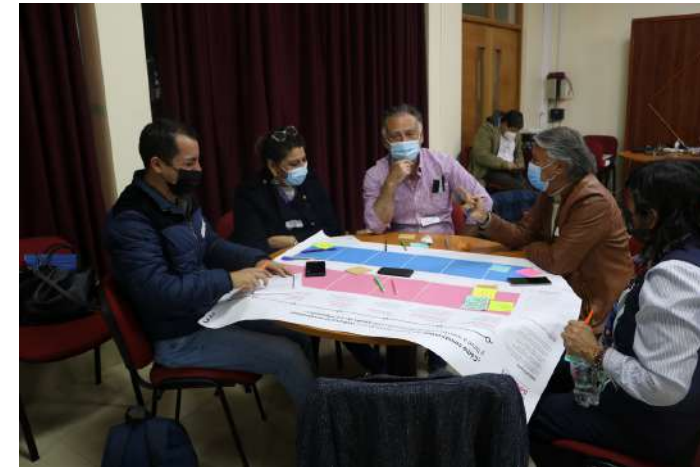
Diálogo por la Reforma Tributaria