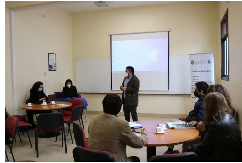
SEREMI de Economía visita la FACSEJ para acordar trabajo conjunto