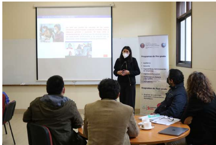
SEREMI de Economía visita la FACSEJ para acordar trabajo conjunto