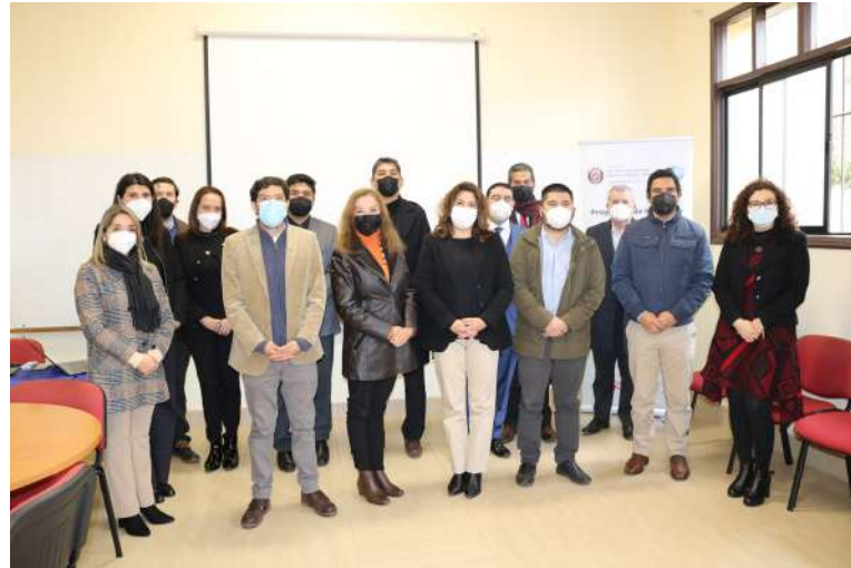
SEREMI de Economía visita la FACSEJ para acordar trabajo conjunto