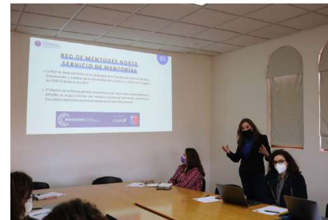
Decana expone en Gabinete Económico Regional