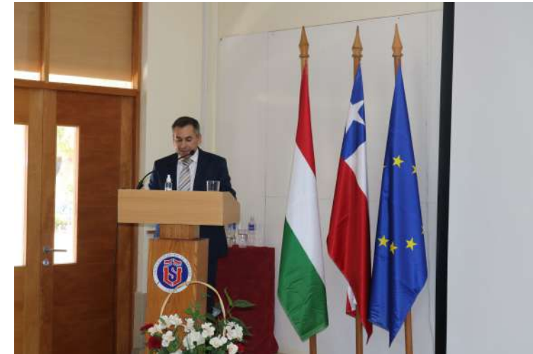
Embajador de Hungría visita la FACSEJ